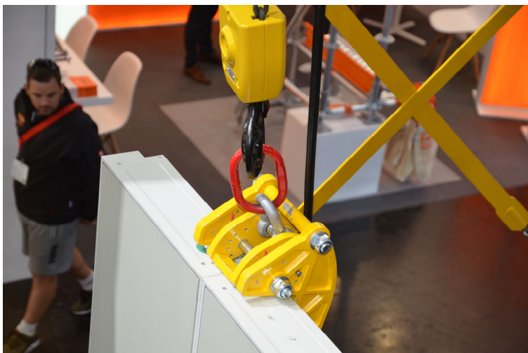
BU: Versetzhaken R-Hook zum leiterlosen Versetzen von Schalungen - Quelle: ROBUSTA-GAUKE