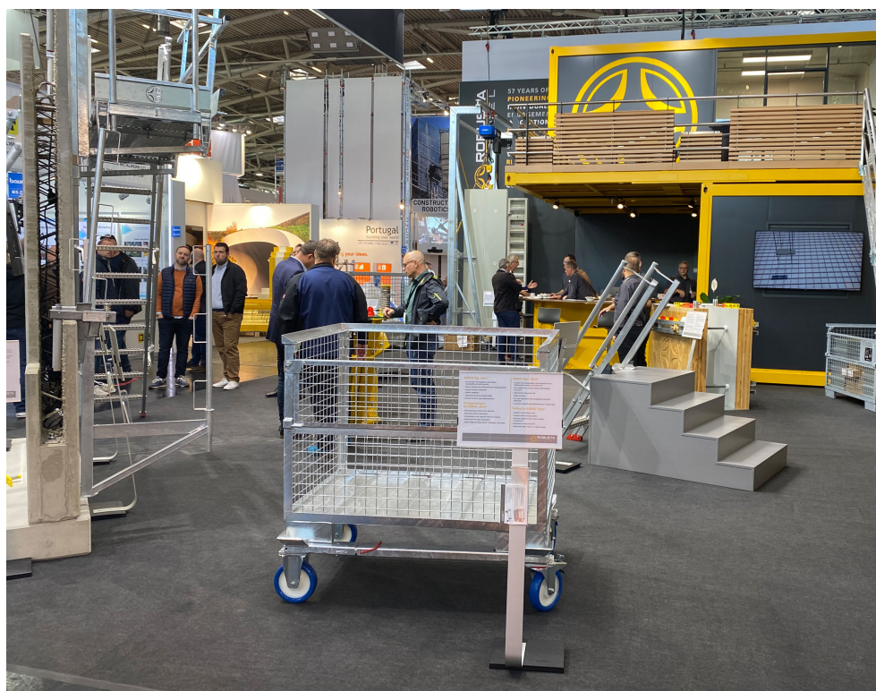
BU: Mit dem teleskopierbaren Transportwagen wird die ROBOX Euro mobil.